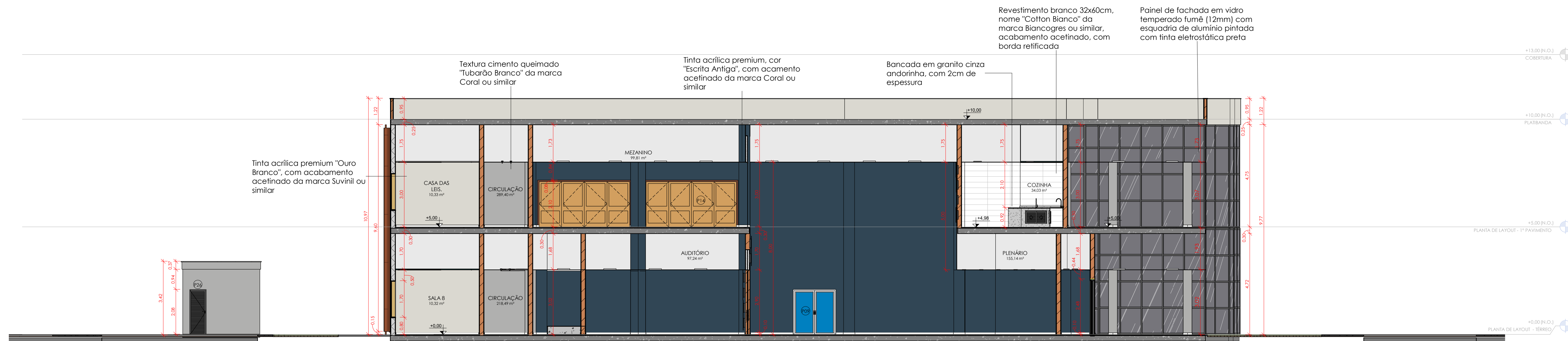
3 CORTE - C-C Escala 1:100